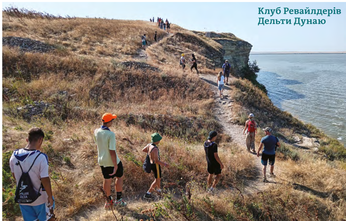
Клуб Ревайлдерів Дельти Дунаю