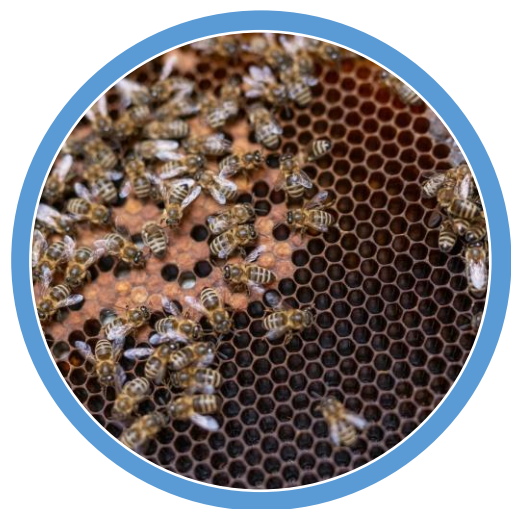
miere de deltă

Natura reînnoită a Deltei Dunării oferă comunităților locale produse alimentare de înaltă calitate care sunt solicitate pe piețele naționale și internaționale, în special: