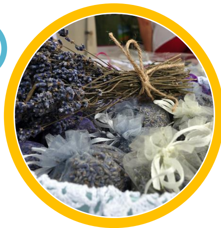
ceai și ierburi locale