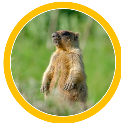
animale de stepă