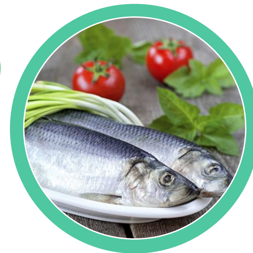
scrumbie de Dunăre